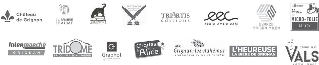
Illustration Nathan Dachelet-Dallaporta - Impression Graphot : www.graphot.fr

27 ème FESTIVAL DE LA CORRESPONDANCE GRIGNAN